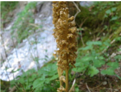
Platz 4 Vogelnestwurz: 18 Ex.