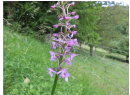
Platz 6 Langspornige Handwurz: 9 Ex.