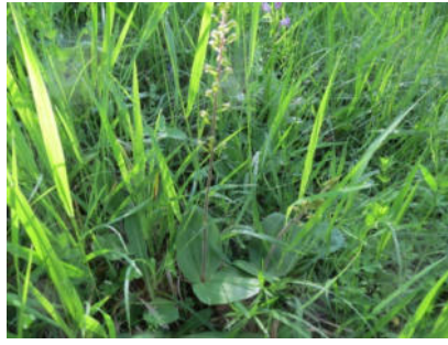
Platz 2 Grosses Zweiblatt: 21 Ex.