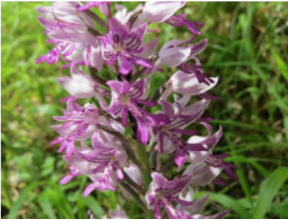
Platz 1 Helmknabenkraut: 81 Ex.