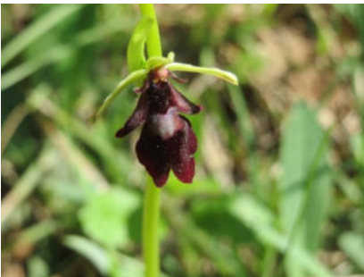
Platz 7 Fliegenragwurz: 6 Ex.

Von diesen Orchideen konnten wir 2018 keine finden: