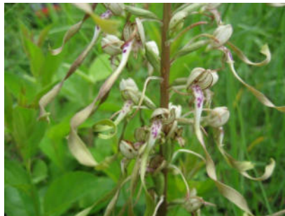
Platz 5 Bocksriemenzunge: 10 Ex.