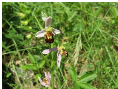
Platz 9 Bienenragwurz: 1 Ex.