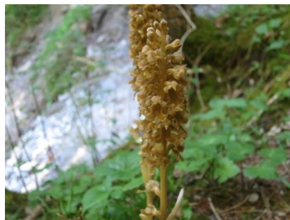
Platz 5 Vogelnestwurz: 24 Ex.