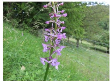
Platz 6 Langspornige Handwurz: 8 Ex.