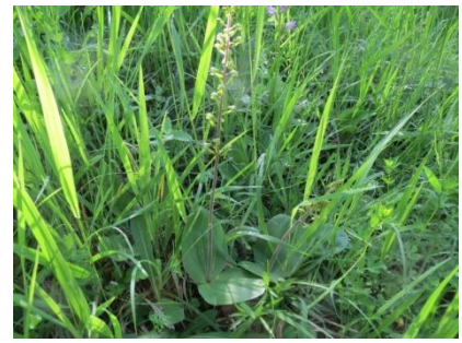
Platz 3 Grosses Zweiblatt: 73 Ex.