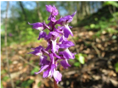
Platz 7 Mannsknabenkraut: 5 Ex.