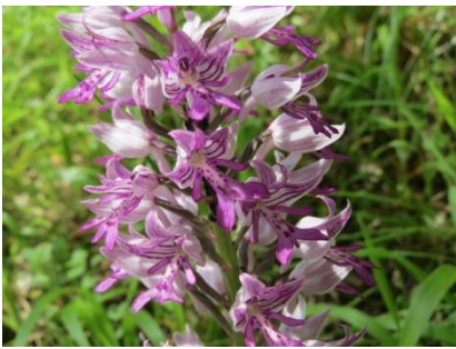
Platz 1 Helmknabenkraut: 88 Ex.