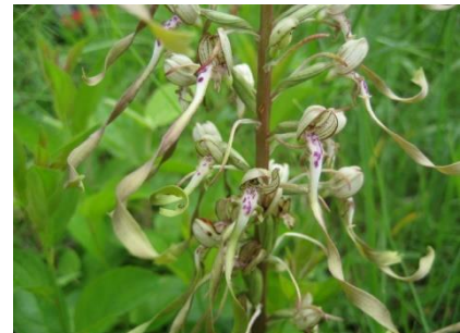
Platz 8 Bocksriemenzunge: 2 Ex.