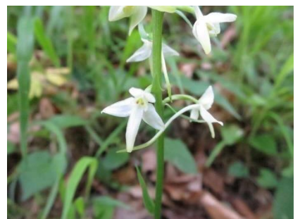
Weisse Waldhyazinthen: Keine gefunden