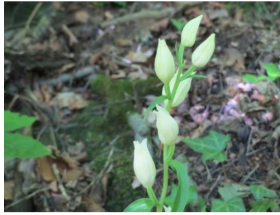
Platz 2 Weisses Waldvögelein: 59