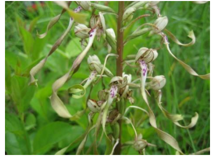
Platz 3 Bocksriemenzunge: 54