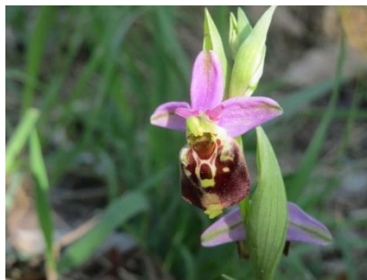
Hummelragwurz: Keine gefunden