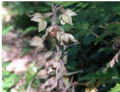
Platz 5 Stendelwurz: 30