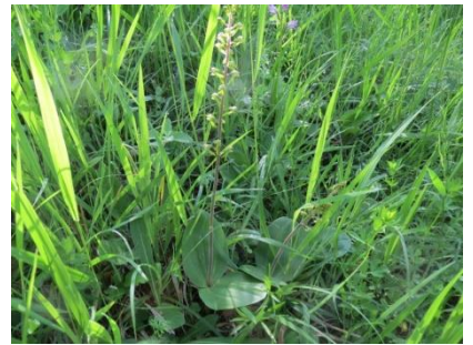
Platz 6 Grosses Zweiblatt: 28