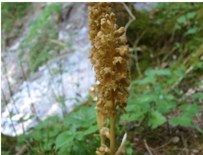
Platz 4 Vogelnestwurz: 37