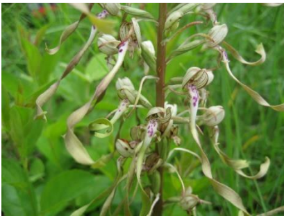
Platz 4 Bocksriemenzunge: 37