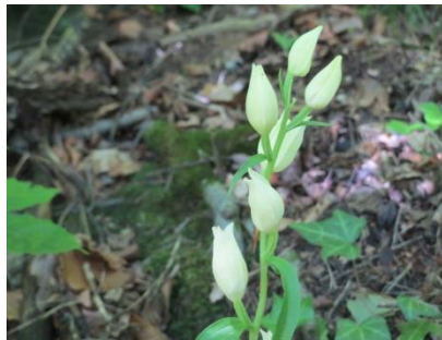
Platz 5 Weisses Waldvögelein: 32