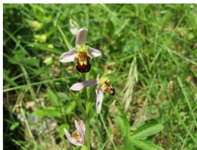
Bienenragwurz: Keine gefunden