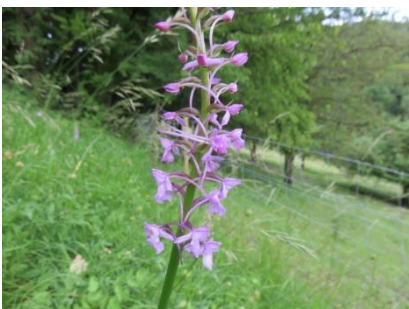
Langspornige Handwurz Keine gefunden