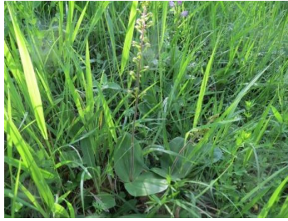
Platz 2 Grosses Zweiblatt: 65