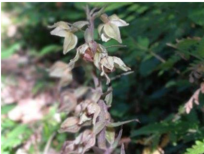
Platz 7: Breitblättrige Stendelwurz: 27